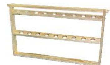
Bišu māšu audzēšanas rāmītis